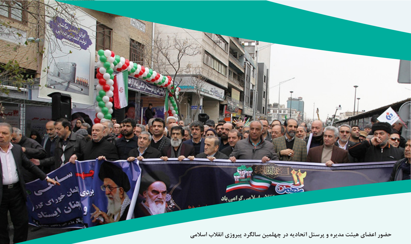
حضور اعضای هیئت مدیره و پرسنل اتحادیه در چهلمین سالگرد پیروزی انقلاب اسلامی